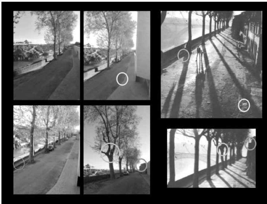
Figura 8 – Assinalamento de pontos comuns identificáveis às duas épocas.

Quanto à obra de Jorge Henriques, a partir da análise desta imagem fotográfica, torna-se possível a confirmação do seu enquadramento dentro das práticas correntes da fotografia portuguesa dos anos 50 e 60.