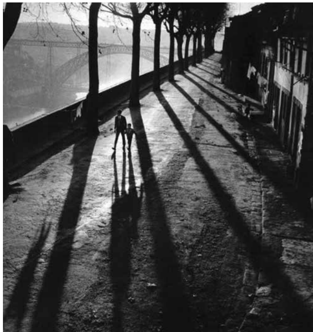
Figura 1 – Sem Título. Jorge Henriques, anos 50/60. Positivo, papel, p/b, 23x24cm, gelatina e sais de prata. Centro Português da Fotografia; Pertence ao conjunto de fotografias que foram selecionadas para a exposição «Domingo de Manhã», patente no CPF no ano de 2002. Código de referência: PT/CPF/JH/00014.

Quanto ao processo de recolha de dados, este passou, em primeiro lugar, pela pesquisa sobre o fotógrafo: no arquivo digital do Centro Português de Fotografia (CPF) 1 . Seguiu-se a leitura de obras bibliográficas relacionadas com o tema e com a exposição em que a fotografia foi apresentada (de seu nome Domingo de manhã... 2 ). Recorreu-se ainda a uma visita presencial ao CPF para obter ainda mais informações sobre Jorge Henriques. Já para o estudo do local, a investigação foi feita sobretudo na plataforma GISA (do Arquivo Histórico Municipal do Porto), no já referido arquivo digital do CPF e em monografias específicas. De seguida, procedeu-se à observação no local e à captação de imagens (ver apêndice 2, 3 e 4), para posterior comparação com registos de outras épocas e, por fim, foi elaborado o presente relatório escrito.