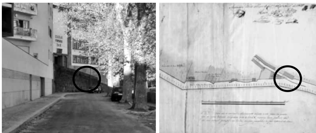
Figura 5 – Possível localização do fotógrafo (Rampa do Sol). Esquerda: Fotografia da autora. Direita: Plano em que se vê a Rua do Sol e o Passeio das Fontainhas, 1839. AHMP, disponível em http://gisaweb.cm-porto.pt/units-ofdescription/documents/334887/?q=rua+do+sol .

Como objetivos deste trabalho, procurou-se responder a algumas questões: Onde estaria posicionado o fotógrafo? A que horas fotografou? Como está hoje o local? Depois do estudo efetuado, os resultados foram bem-sucedidos. Através da deslocação ao local, depreendemos que o fotógrafo estaria posicionado na rampa da Rua do Sol, com o olhar apontado para o Passeio das Fontainhas (no sentido da Ponte Luís I). Analisando a direção das sombras, através de fotografias em diferentes alturas do dia e com o auxílio de um relógio de sol desenhado manualmente, conclui-se que seriam aproximadamente dez horas da manhã quando Jorge Henriques criou a fotografia.