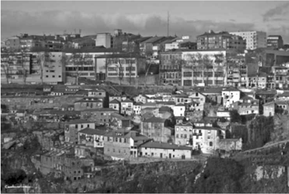
Figura 6 – Vista sobre a rampa da Rua do Sol, Carlos Silva, 2012. AHMP, disponível em http://porto-sentido.blogspot.pt/tag/fontainhas .

Numa última fase, comparou-se o estado atual da área fotografada com a imagem fotográfica, assinalando os elementos identificáveis que ainda se assemelham aos captados nos anos 50/60. Assim sendo, sabemos que o Passeio das Fontainhas não foi alvo de grandes transformações estruturais, excetuando as que respeitam à edificação da Cooperativa de Habitação de S. João das Fontainhas, mas que a sua envolvente foi bastante modificada tendo em conta as derrocadas da escarpa, a construção de elementos como a Ponte do Infante, o Viaduto e Parque de Estacionamento Duque de Loulé.