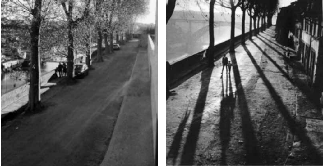
Figura 3 – Comparação entre sombras a diferentes horas do dia. Esquerda: fim da tarde. Direita: c. 12:00(?)