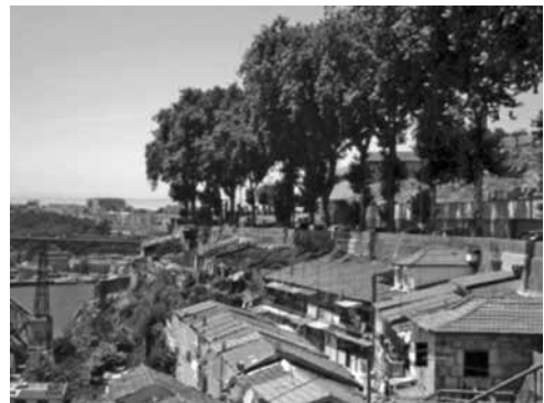
Figura 7 – Esquerda: Passeio das Fontainhas antes da construção do edifício da Cooperativa, com vista da rampa da Rua do Sol (direita), João Avila, 2013, retirada de ÁVILA, João – O espaço sobranste: o caso dos viadutos, dissertação e Mestrado Integrado em Arquitetura, apresentada à Faculdade de Comunicação, Arquitectura, Artes e Tecnologias da Informação da Universidade Lusófona, sob orientação do Professor Dr. Arq. Manuel Joaquim Soeiro Moreno, Porto, 2013, p. 52. Direita: Passeio das Fontainhas durante a construção do edifício da Cooperativa. Vista para os plátanos.