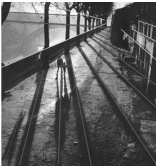
Figura 2 – Linhas identificáveis na imagem fotográfica

Predominam as linhas retas oblíquas, com algumas verticais e horizontais, que se interseccionam, atribuindo à imagem fotográfica dinamismo e ritmo através da repetição, visíveis, por exemplo, nas árvores, nas sombras, nos tabuleiros da ponte (ver apêndice 1). Nota-se uma certa inclinação da linha do horizonte, que é elevada, mas conservando a verticalidade de alguns elementos como as árvores.