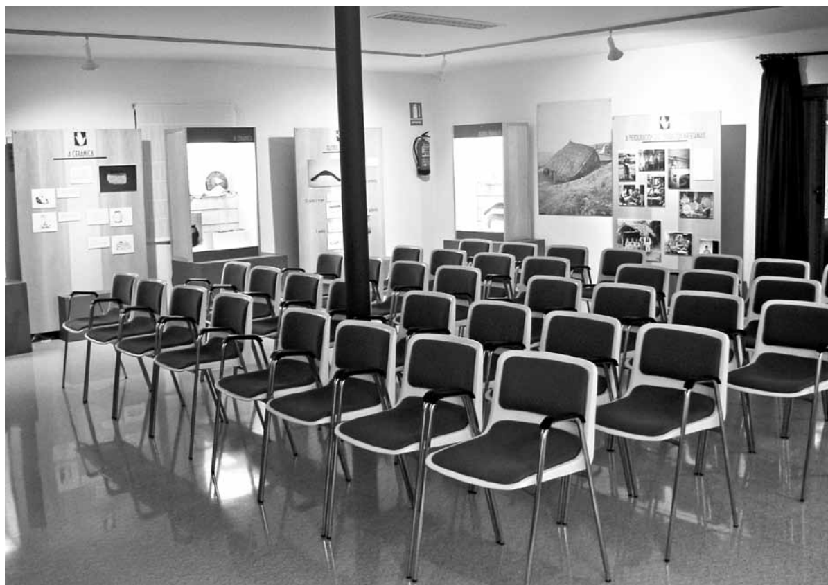
Fig. 4.1. – Sala de Actos do Museo con exposición temporal.