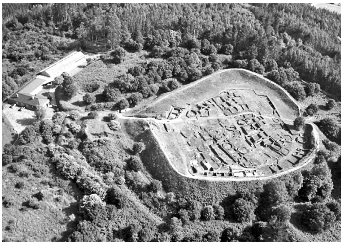
Fig. 2.2. – O Castro durante os traballos de consolidación en 2012.