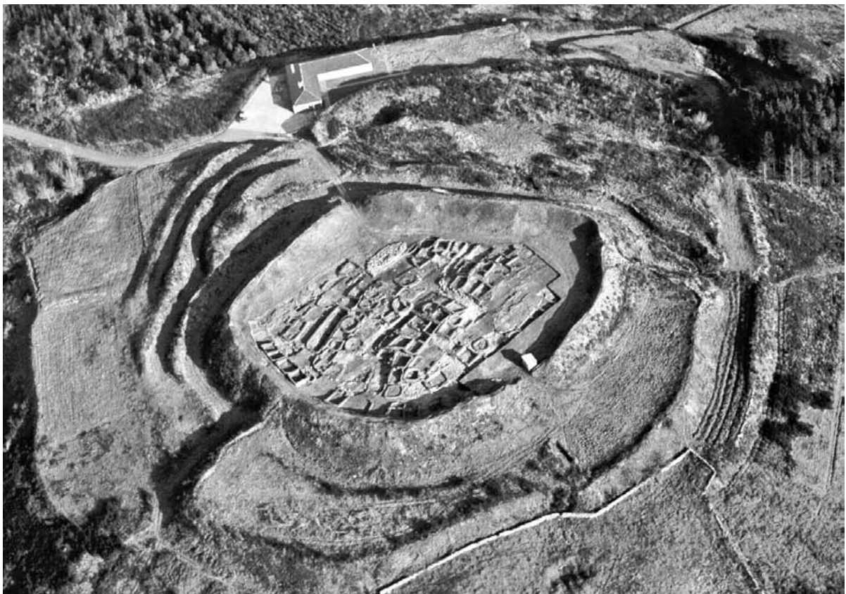
Fig. 1.2. – O conxunto do Castro e o Museo á altura de 1986.