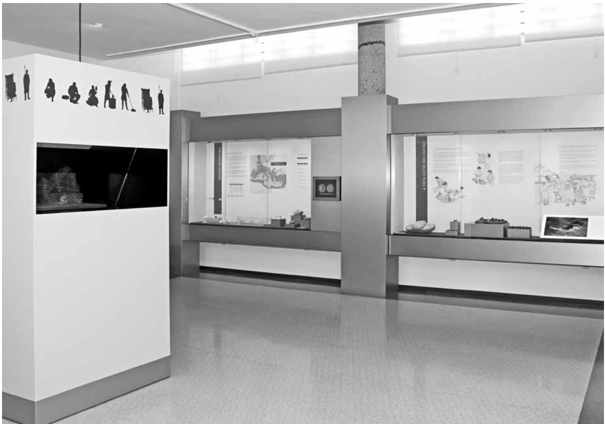
Fig. 3.2. – Pormenor da Sala 3 do Museo.