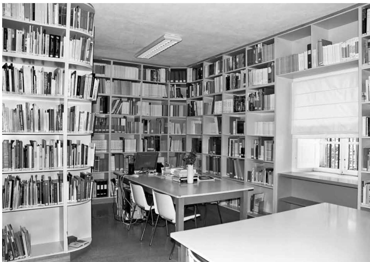
Fig. 4.2. – A biblioteca auxiliar especializada do Museo.