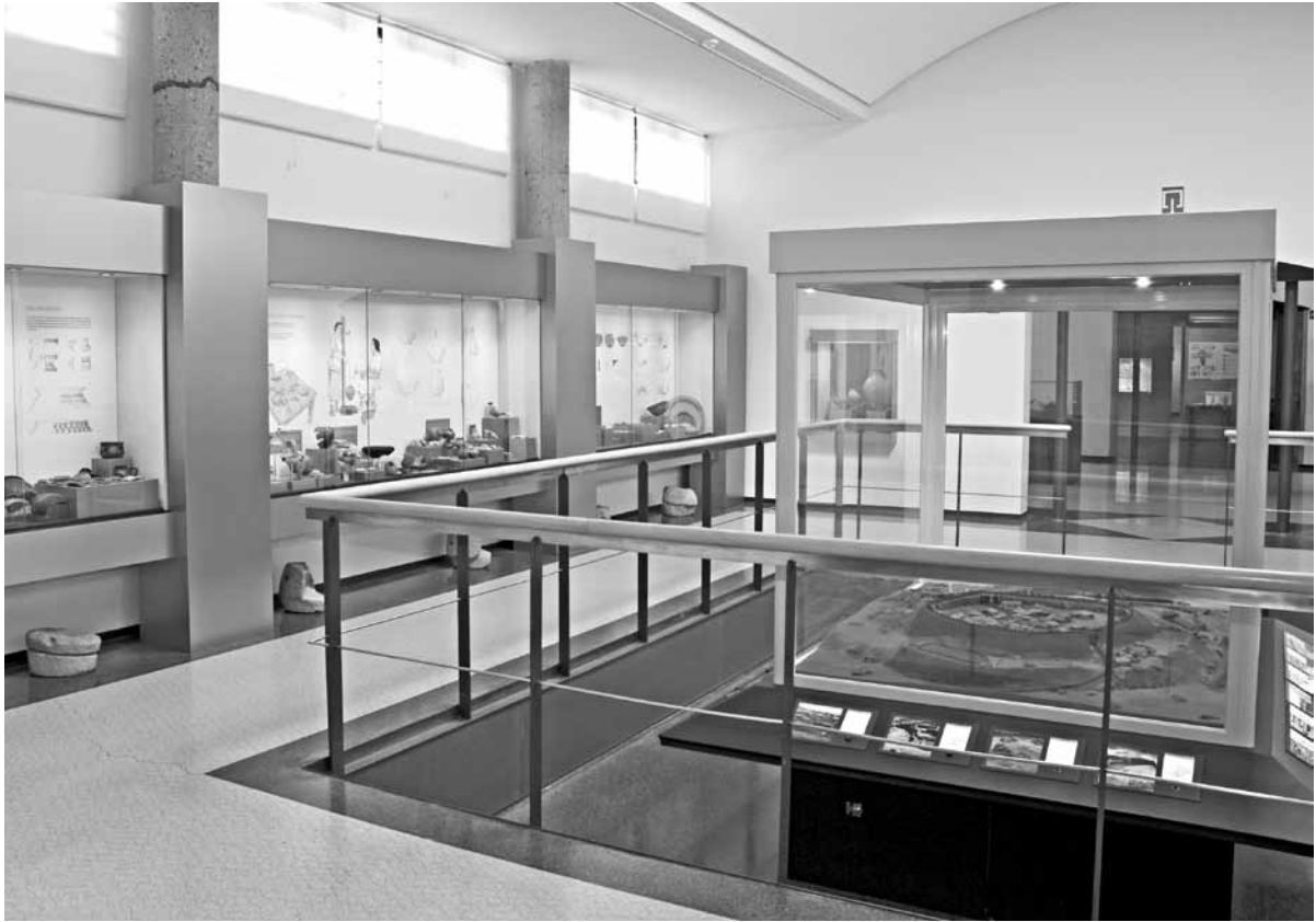
Fig. 3.1. – A Sala 2 da exposición permanente no Museo.