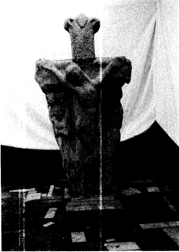
Fig. 1 – Cruz da Tahona. Anverso.