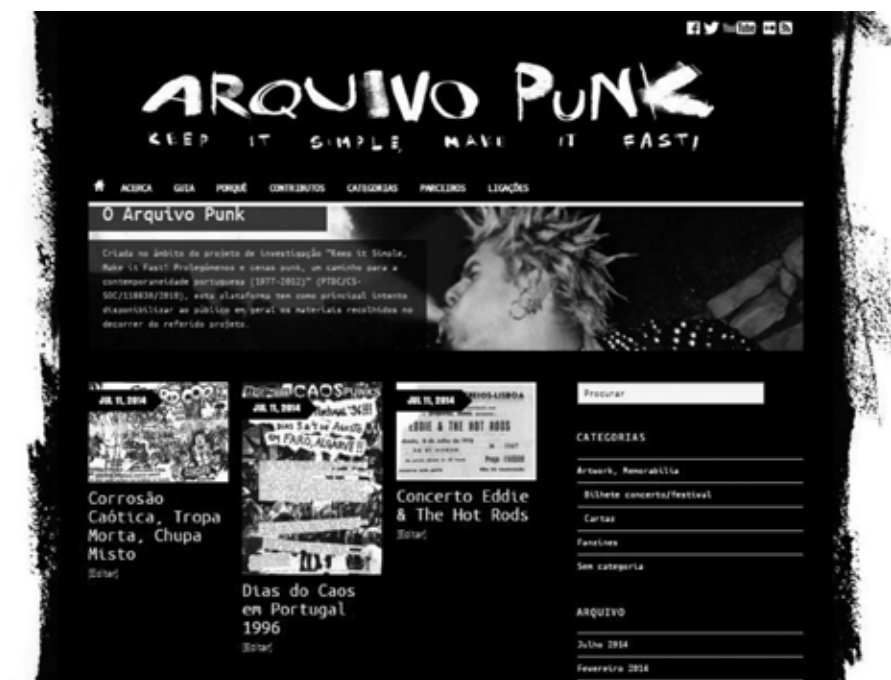
Figuras 1 e 2: Layout do sítio do arquivo punk

revistas relacionados com o punk português 7 . Trata-se de uma vertente do projeto da maior relevância, atendendo nomeadamente a um contexto em que, como referido anteriormente, as manifestações punk estiveram – e estão ainda – ausentes da ‘agenda’ de investigação das ciências sociais e em que os media mainstream se limitam a reproduzir amiúde um conjunto de estereótipos e de ‘lugares comuns’. A constituição deste arquivo assume-se, assim, enquanto um instrumento de pesquisa muito relevante para o desenvolvimento de uma ‘contra-história’ do punk em Portugal, tornando visível uma realidade socio-histórica que, apesar do seu forte dinamismo, permanece ainda largamente invisível na sociedade portuguesa (Guerra, 2013; Silva e Guerra, 2015) 8 .