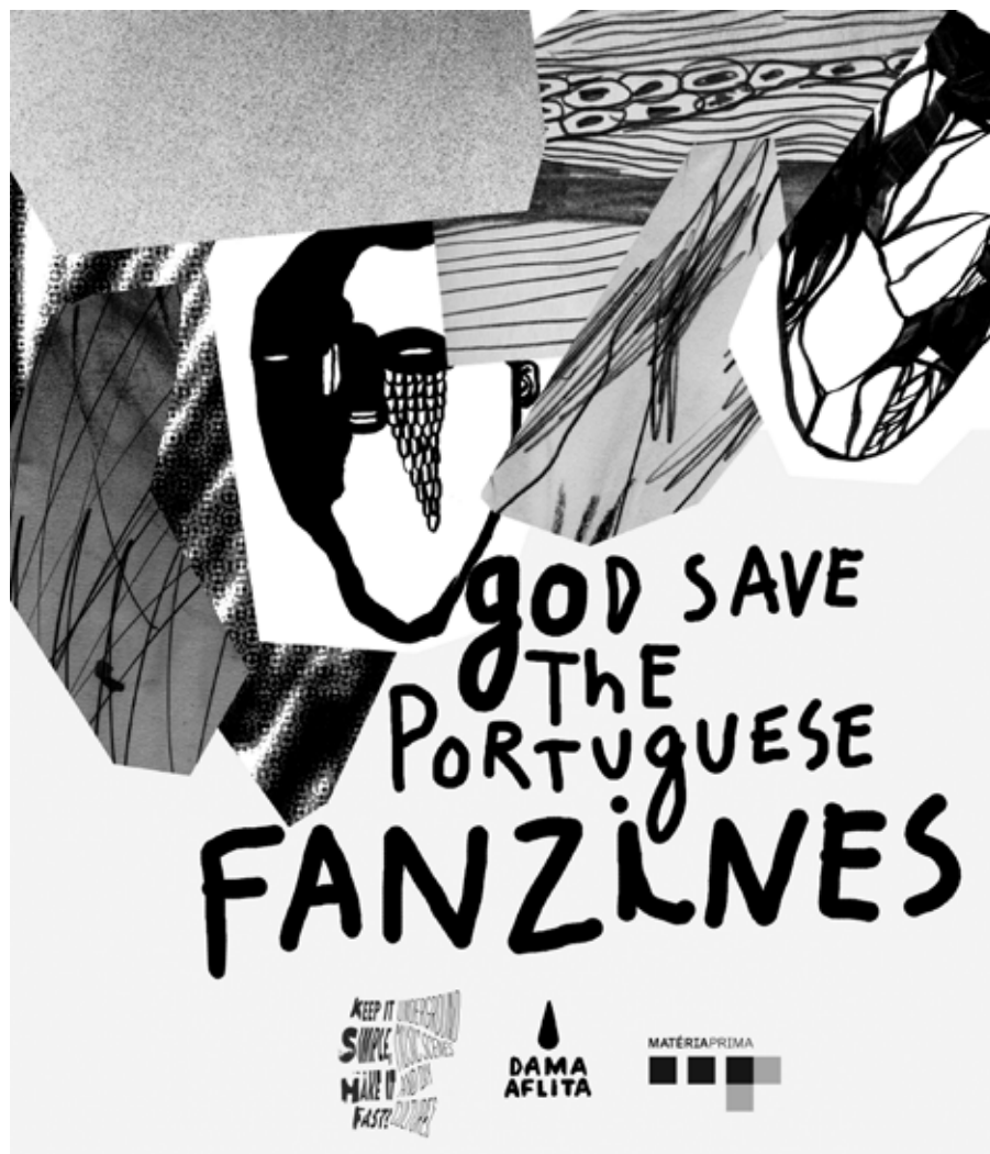
Figura 3 Cartaz da exposição God Save The Portuguese Fanzines

Fonte: Cartaz da autoria de Júlio Dolbeth disponível em http://www.punk.pt