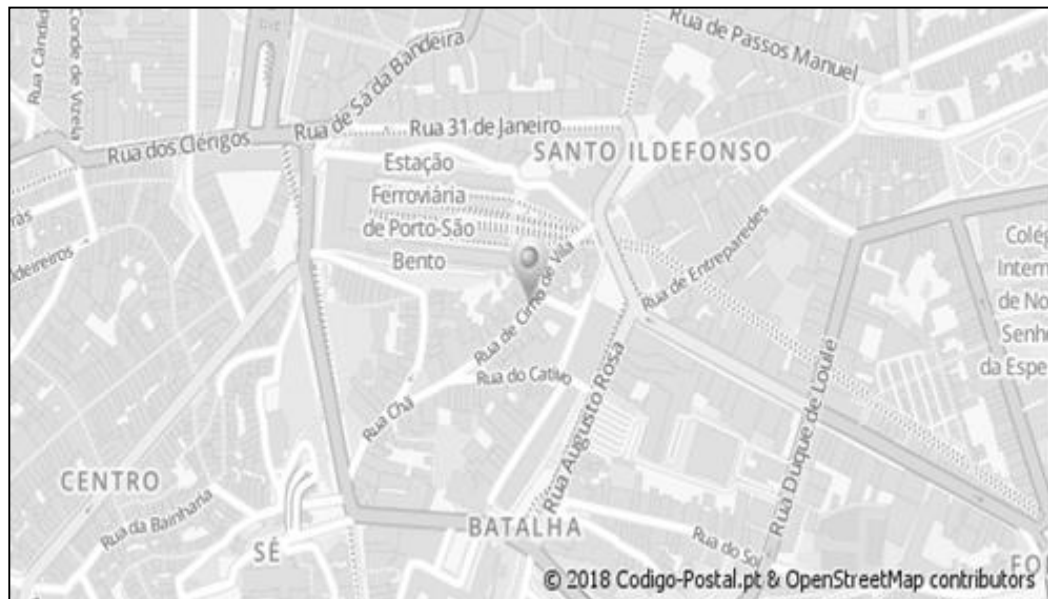
Figura 2: Localização da Rua Cimo de Vila

etnográfico foi realizado tendo em conta um critério de comparabilidade, isto é, o contexto explorado no Porto, deveria possuir elementos em comum com os territórios trabalhados previamente por Nicodemos no Brasil.