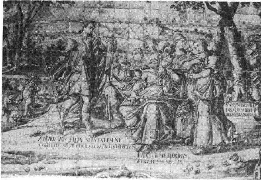
Fig. 2 — Sé do Porto. Claustro. Pormenor de painel. Interpretação alegórica mariana do Cântico dos Cânticos (II, 1 e 7). Valentim de Almeida (Lisboa), 1729/31.