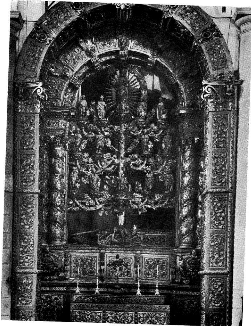
Fig. 3 - A Arvore de Jessé da igreja de Santa Maria de Beja.