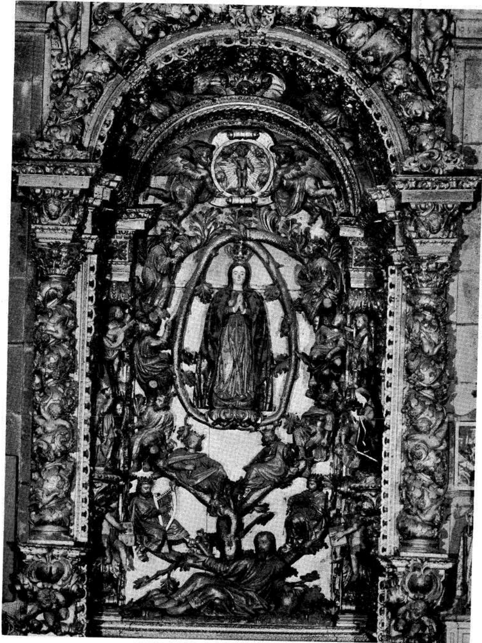
Fig. 5-A Árvore de Jessé da igreja do Colégio de S. Paulo de Braga (ou igreja de Santiago).