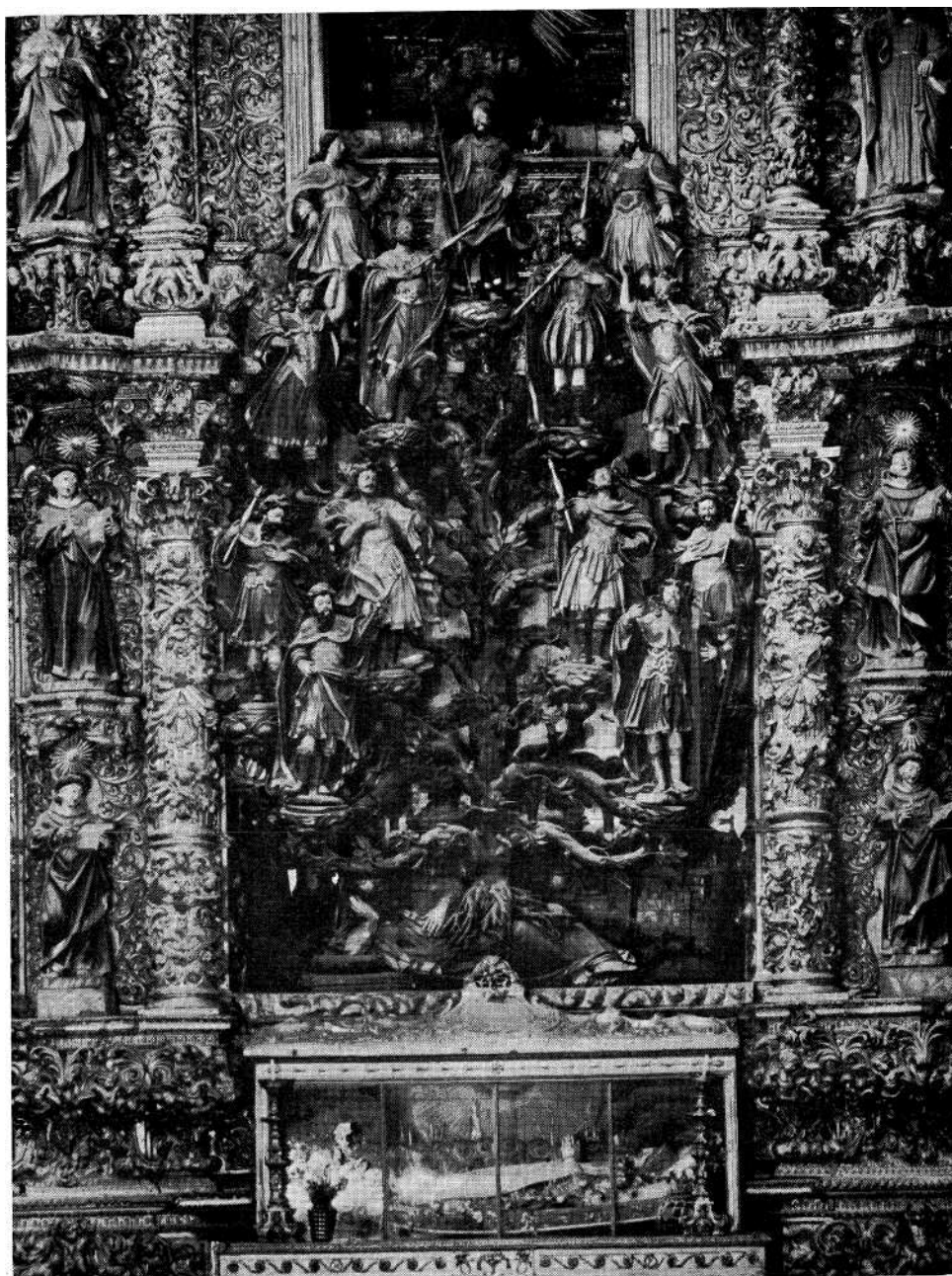
Fig. 4 — A Árvore de Jessé da igreja do convento de S. Francisco do Porto.