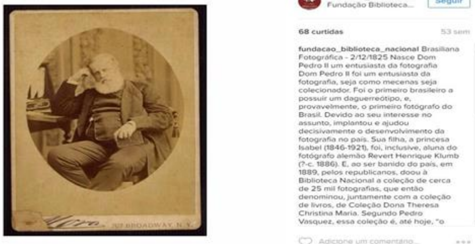
Figura 3 - Brasileira fotográfica 2/12/1825: nasce Dom Pedro II