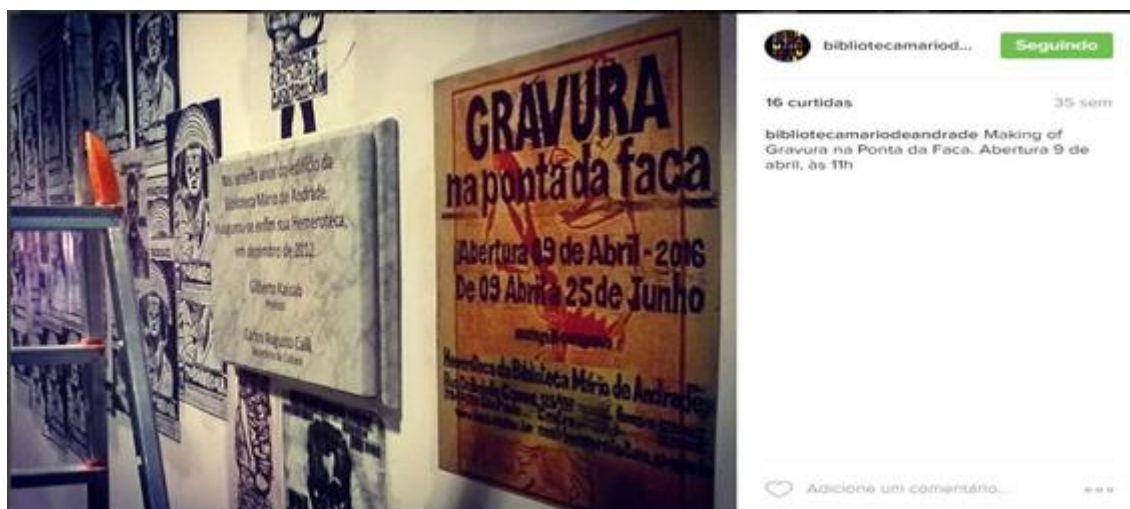
Figura 2 - Making of Gravura na Ponta da Faca