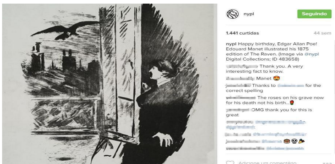
Figura 5 - Feliz aniversário, Edgar Allan Poe!

exemplares são escolhidos com base em algum acontecimento que marca a data da postagem, incluindo feriados nacionais ou internacionais, data de aniversário e morte de autores e celebridades ou temas específicos que podem atrair a atenção de determinados usuários, levando-os a conhecer mais sobre aquele tema e acontecimento. É o caso dos exemplos descritos a seguir. Posteriormente ao lançamento do jogo para smartphones Pokémon Go em 2016, a unidade da NYPL West New Brighton reuniu e expôs em seu espaço livros, gibis e DVDs da animação que inspirou o jogo e que poderiam interessar aos usuários do aplicativo. Esta pequena exposição foi publicada no perfil do Instagram (NEW YORK PUBLIC LIBRARY, 2016k). Para lembrar o aniversário de Edgar Allan Poe no dia 19 de janeiro, a biblioteca postou uma ilustração da capa do livro O corvo , publicada em 1875 e que está disponível na base NYPL Digital Collections .