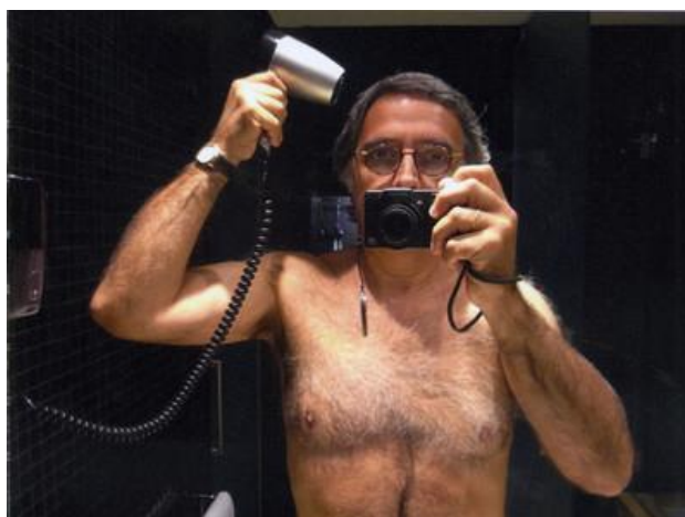
Imagem 1 – Fontcuberta, Através del Espejo , Fotografia, 2012-2013.