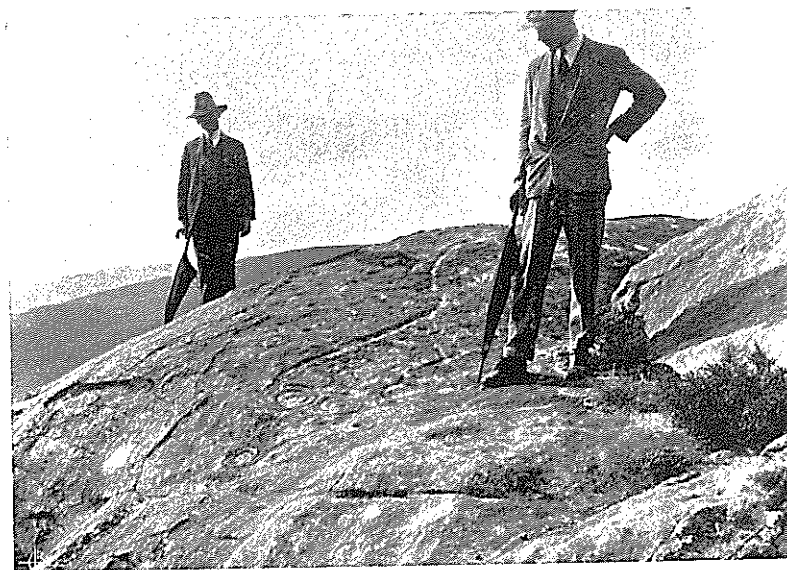
2 — Insculturas dos Fornos dos Moiros