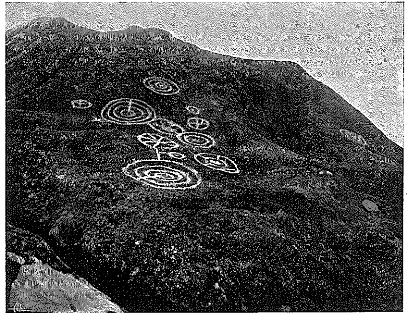
2—Outeiro dos Riscos (Cepelos)