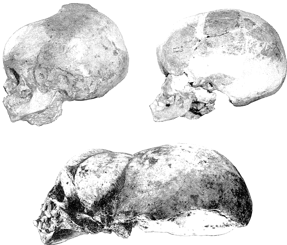
Fig. 3 — En haut, à gauche, vue latérale du crâne XXIII ; A droite, vue latérale du crâne XXIV ; En bas, le crâne XXIV avant sa reconstitution.