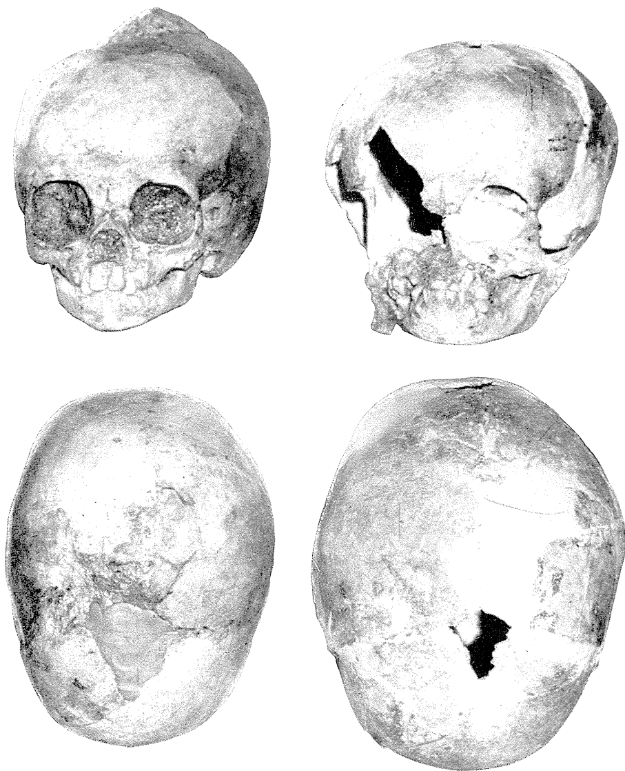
Fig. 4 — A gauche, vue faciale et supérieure du crâne XXIII ; A droite, vue faciale et supérieure du crâne XXIV.