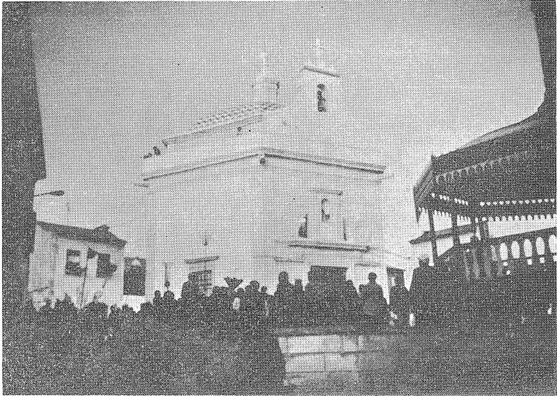
Fig. 1 — A capela de S. Gonçalinho e a multidão à espera do atirar das cavacas pelas pessoas que estão na platibanda ou varandim.

Quando ia a subir as escadas de pedra em caracol que partem da sacristia, um dos mordomos da festa disse-me para não subir sem averiguar se alguém vinha a descer.