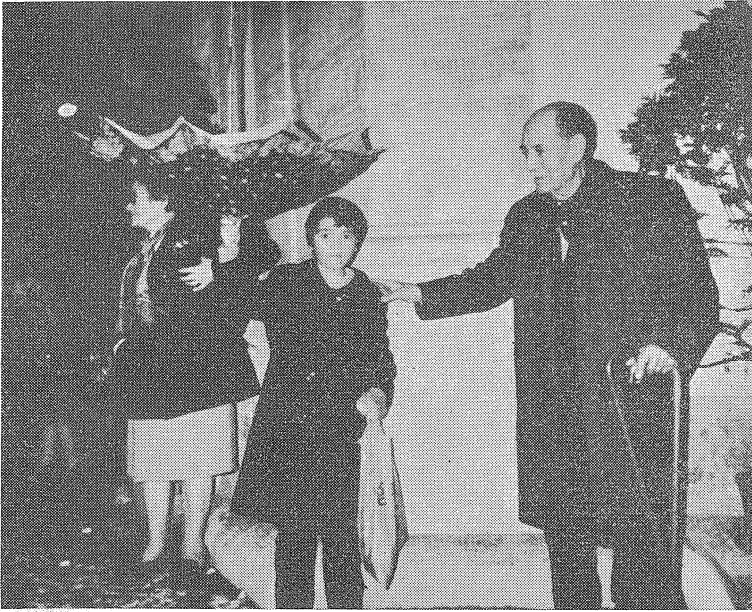
Fig. 5 — Uma garotinha, que se deixou fotografar pelo meu companheiro Gervásio Aleluia com o guarda-chuva aberto em concha já caçara no ar as cavacas que tinha na saca.

à roda da capela vi o chão astrado de pedaços de cavacas todos pequenos. Os maiores eram poucos os que excediam o tamanho de bugalhos.