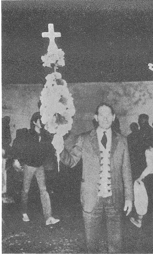
Fig. 6—O velho ramo da mordonia que todos os anos é entregue aos mordomos que entram.

Este ano não soube que se tenha feito tal dança dos mancos.