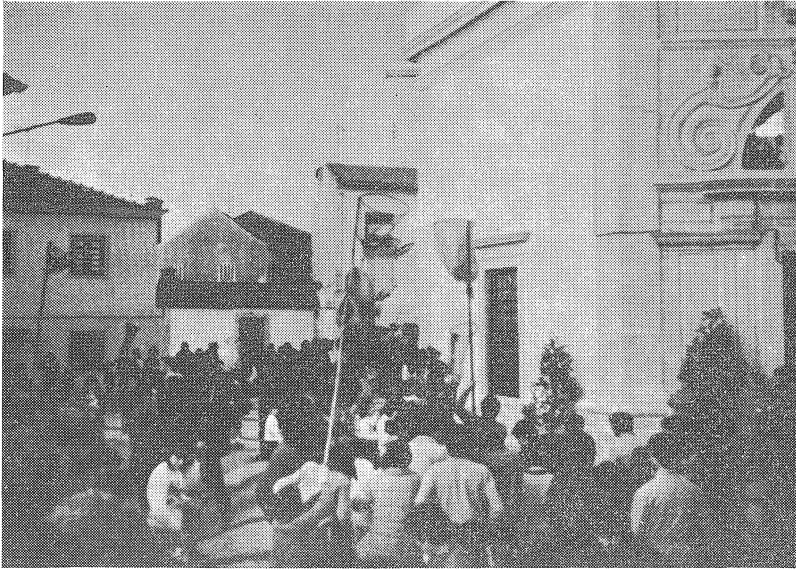
Fig. 3 — O atirar das cavacas a um dos lados da capela.

Uma que me vinha direita à cabeça amparei-a com a mão, que me ficou a doer um bom pedaço, e que o companheiro a meu lado ainda apanhou no ar, saltada do embate na minha mão.